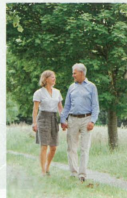
Körperlich aktiv Ein flotter Spaziergang im Grünen verbessert den Zuckerstoffwechsel

Eine effektive Diabetesbehandlung (etwa mit Metformin zur Blutzuckersenkung) ist entscheidend, um derartige Folgeschäden zu vermeiden. Außerdem zeigten Untersuchungen, dass natürliches Arginin eine wichtige Schutzfunktion