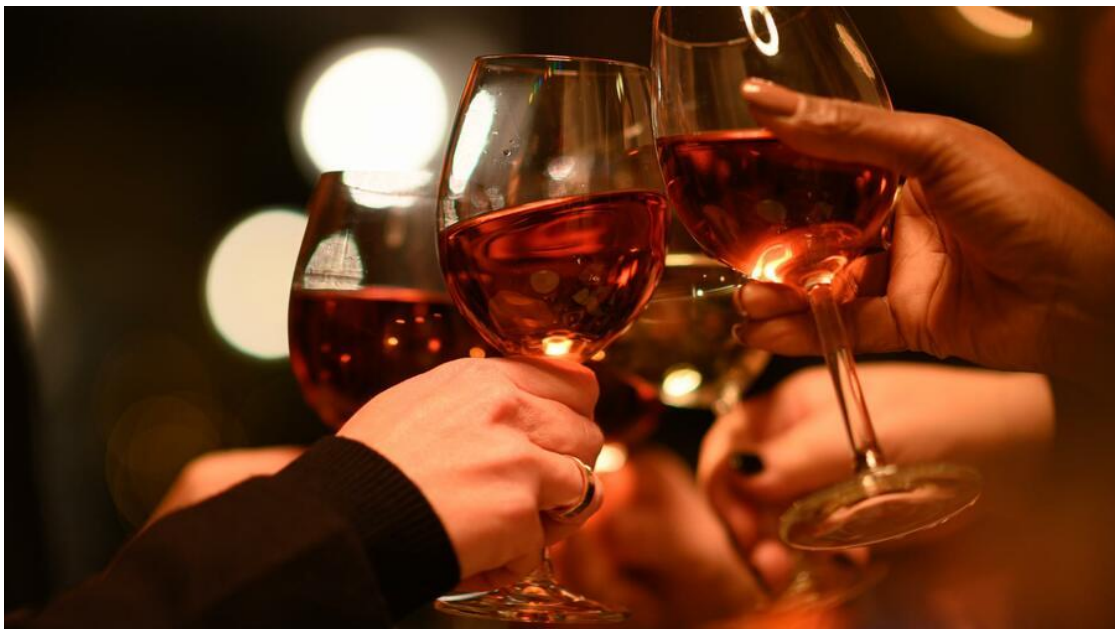
Anstoßen nach Feierabend

Ein Glas Wein zum Runterkommen gehört bei vielen Führungskräften zum Alltag. Wenn Aufhören noch keine Option ist, kann eine alternative Methode helfen.